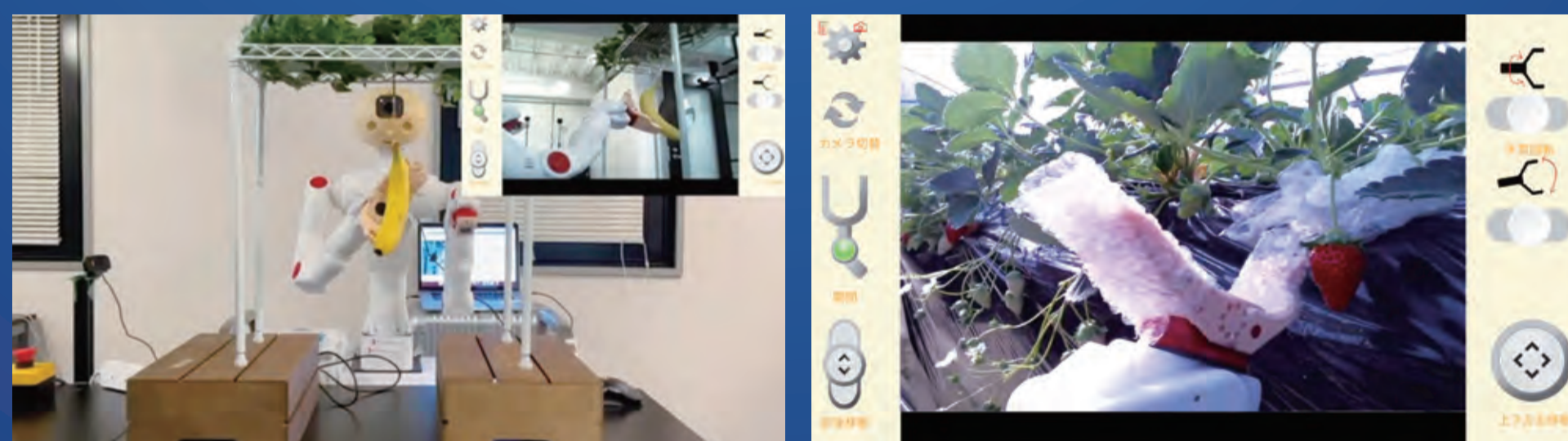
【観光農園の収穫体験】

筋変位センサを腕に装着し、遠隔地のロボットの把持を操作することによって、ロボットを通じた体験をユーザーに提供します。