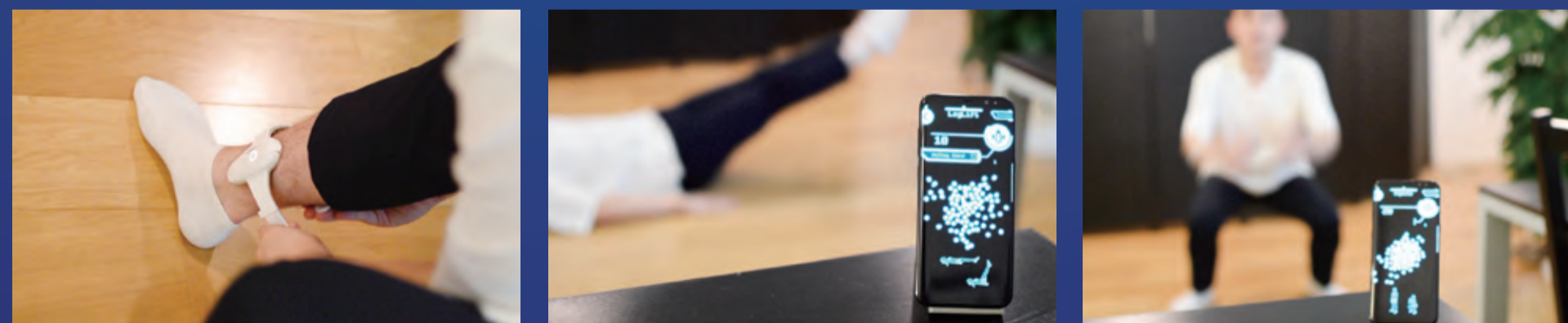
【エクササイズシーンでの利用】

ユーザーのエクササイズ時の加速度ジャイロの値から姿勢データに変換し、運動時の姿勢や激しさを解析します。正しい動きとユーザーの動きを比較し、指示をすることで、エクササイズ効率の向上に繋げることができます。